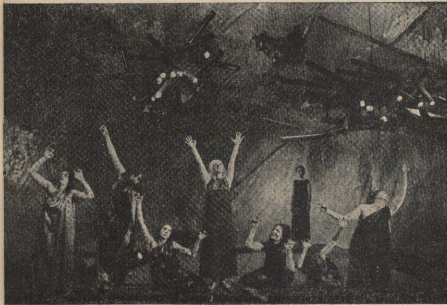
SIEDMIU PRZECIW TEBOM — ANTYGONA