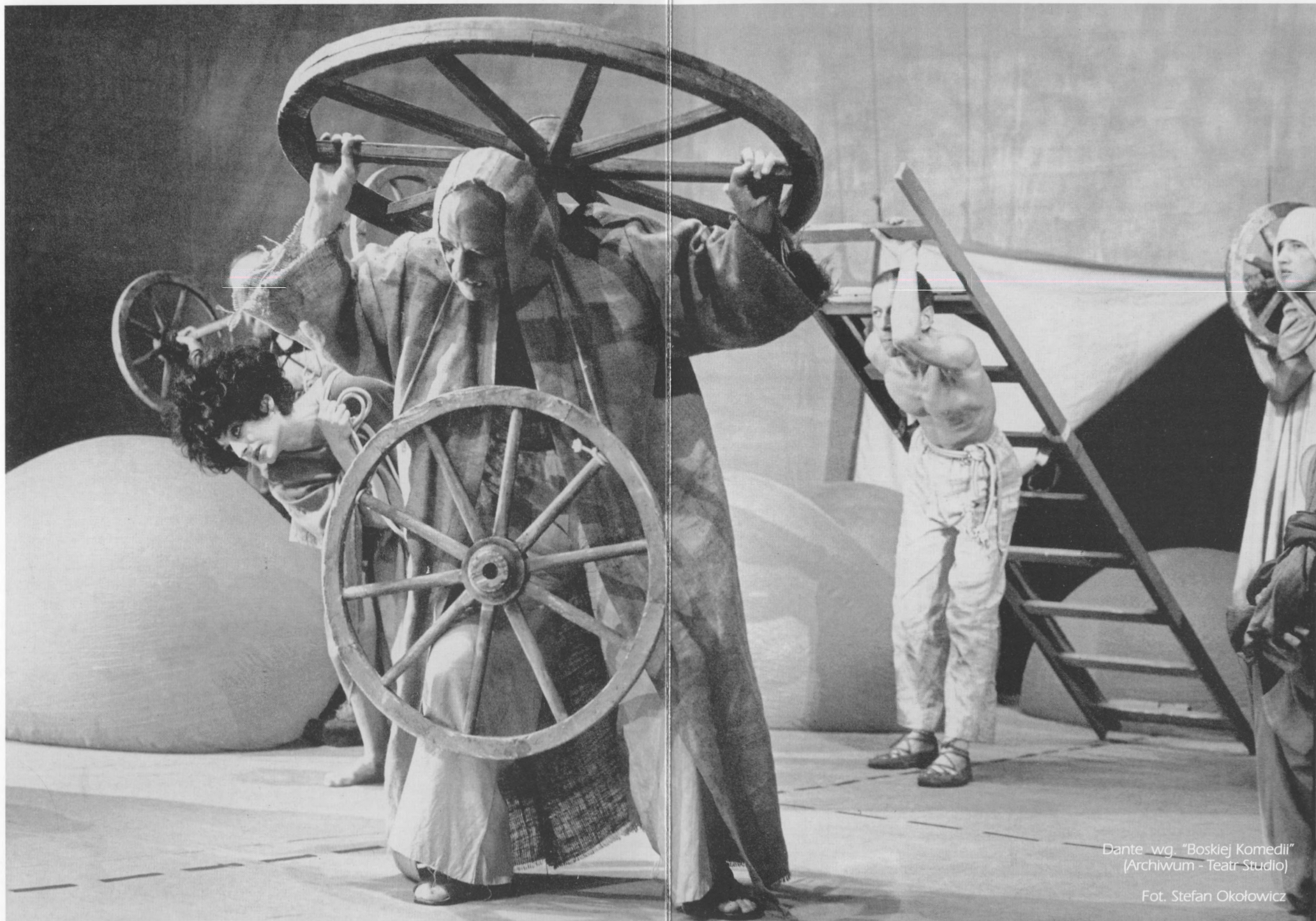
Dante wg. "Boskiej Komedii"