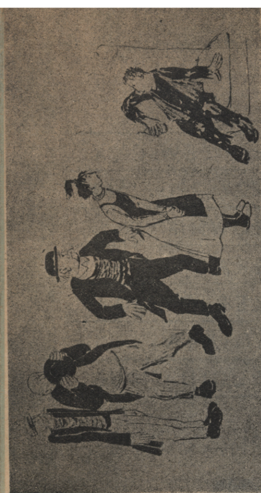
INSCENIZACJA „BOHATERA ZACHODNIEGO ŚWIATA“ W TEATRZE B. BRECHTA (projekt K. von Appen).