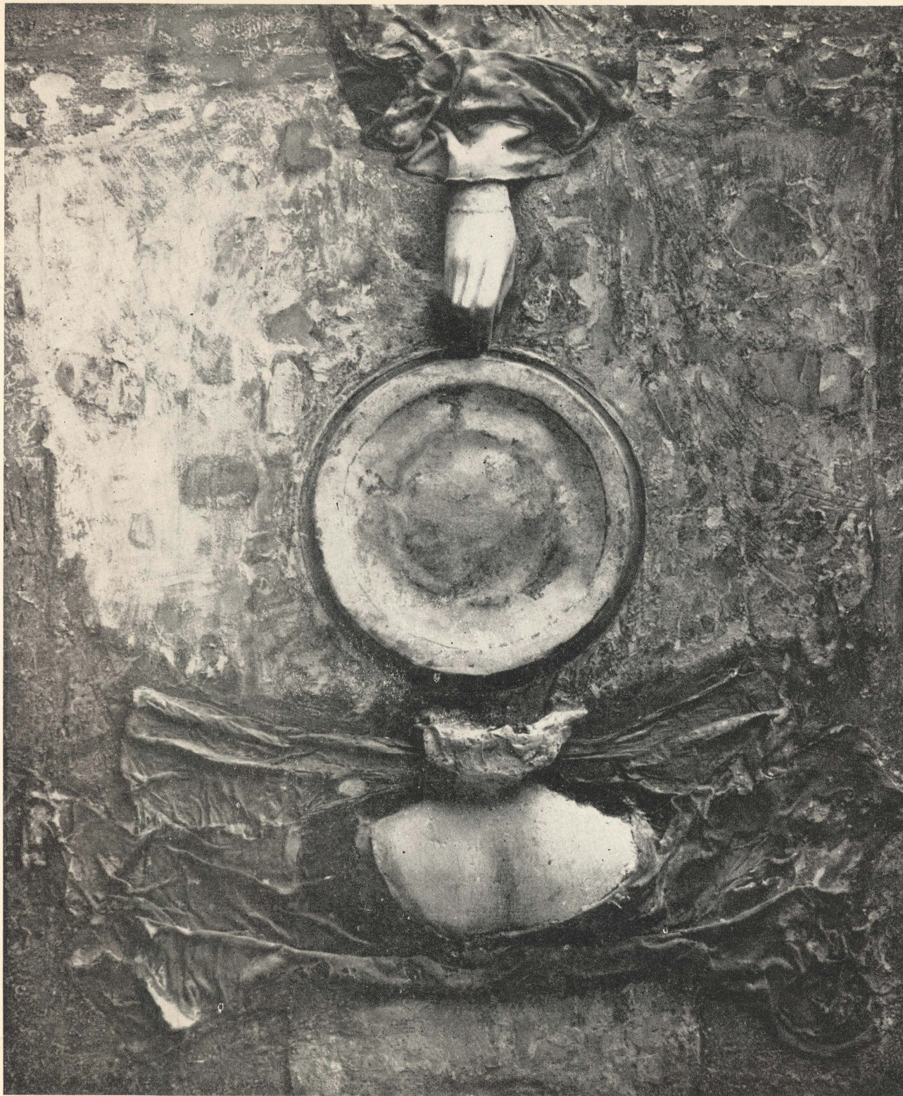
Reminiscencje 1939—1945 (fragment)