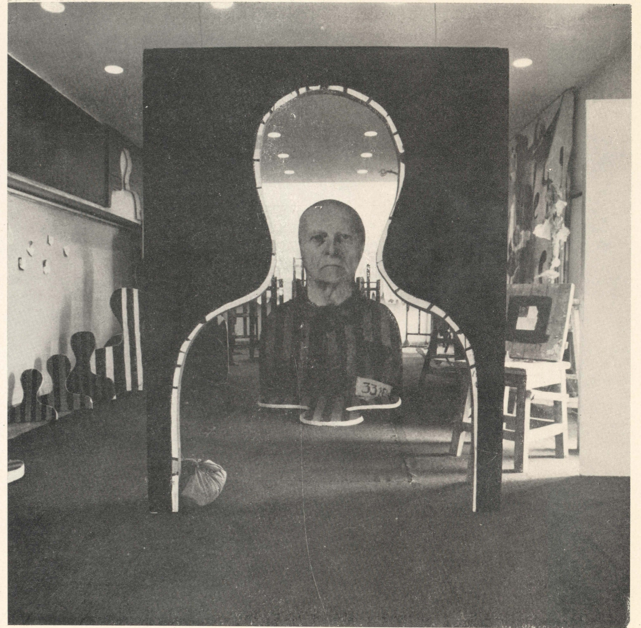
Reminiscencje 1939—1945 (fragment)