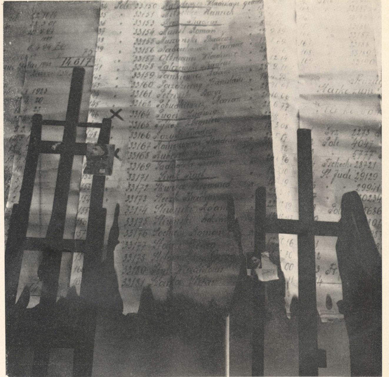
Epitafium II 1968