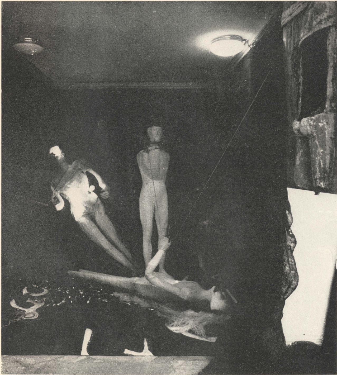
Reminiscencje 1939—1945 (fragment)