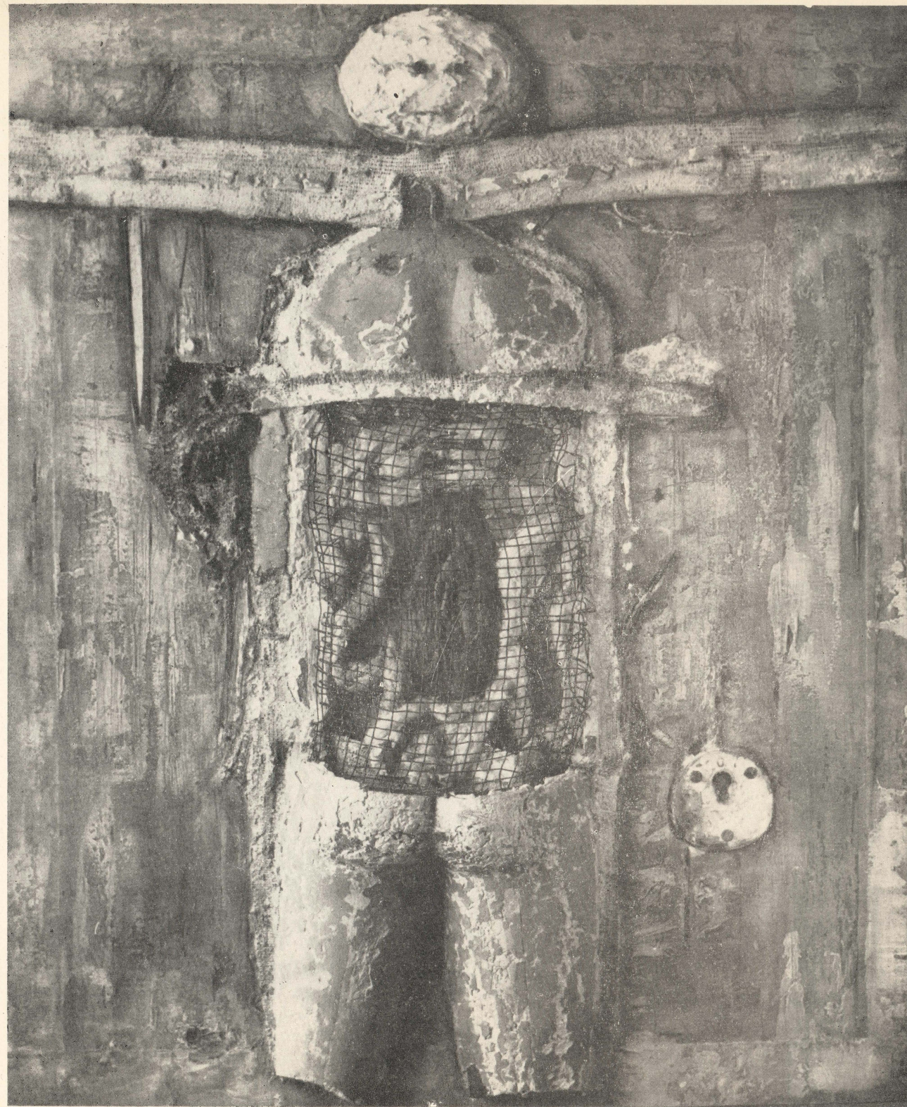
Reminiscencje 1939—1945 (fragment)