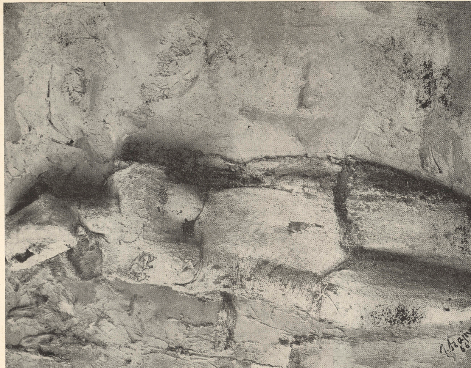
epitafium 1 epitaph 1