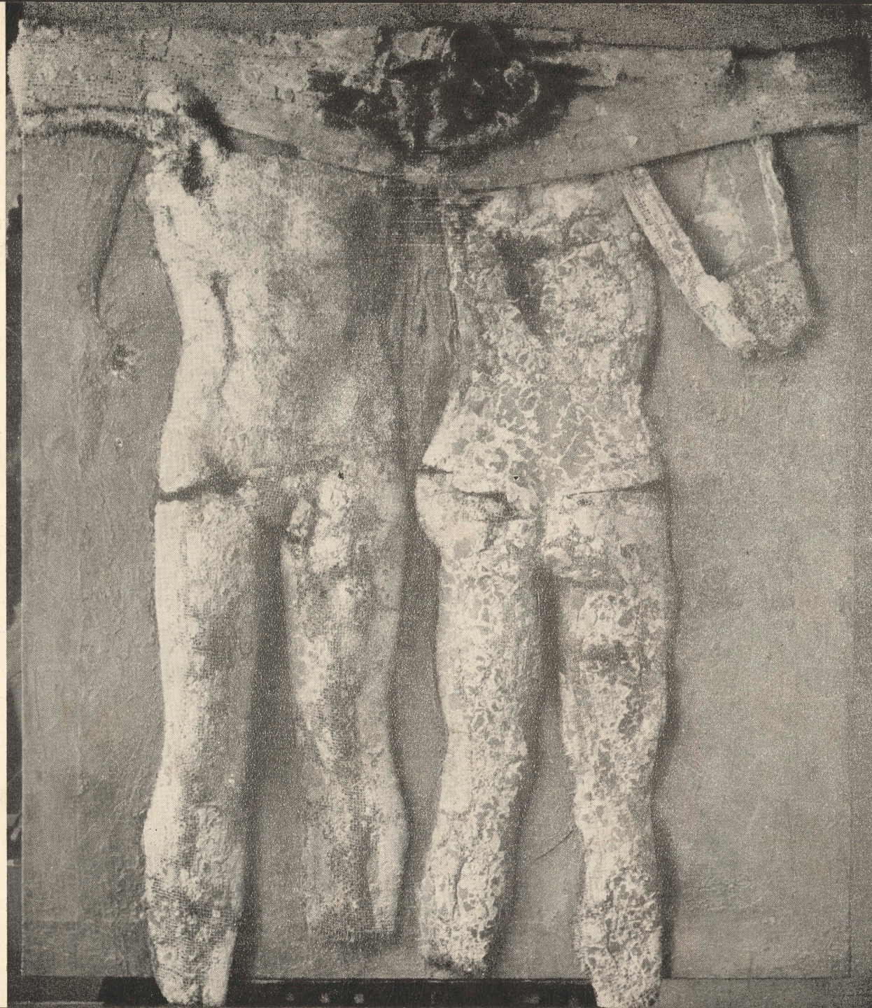
dwoje les deux